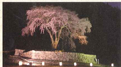
水戸野のシダレザクラ

白山信仰を開いた泰澄(たいしやう)大師が開山した。この山には不動明王や9頭の龍、十一面観音などの守護神が現れ、山頂に、菊理姫神、伊弉諾尊、大己貴命の三尊が迎えられたという。本殿の天井には、洞雲寺の青年僧眉毛(びもう)が描いた絵天井があり、天井いっぱい広がる素晴らしい32枚の絵天井は一見の価値がある。敷地内には、国指定天然記念物で樹齢1200年の大杉もあり、訪れた者を魅了している。