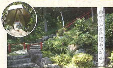
やすらぎの里 隠居山観音

白川橋は、JR高山線の新設工事が進み白川口駅の開業した時代の正15年に完成した鋼製の吊り橋です。それから100年以上の間、床材が木材からコンクリートに変わった以外、全く変わらない姿を残しているのは、当時の国産技術の高さを証明していると言えます。当時としては欧風のデザインも洗練されていて大変貴重な存在です。平成2年には橋のライトアップを始め、飛騨川の水面に美しい姿が映し出されます。